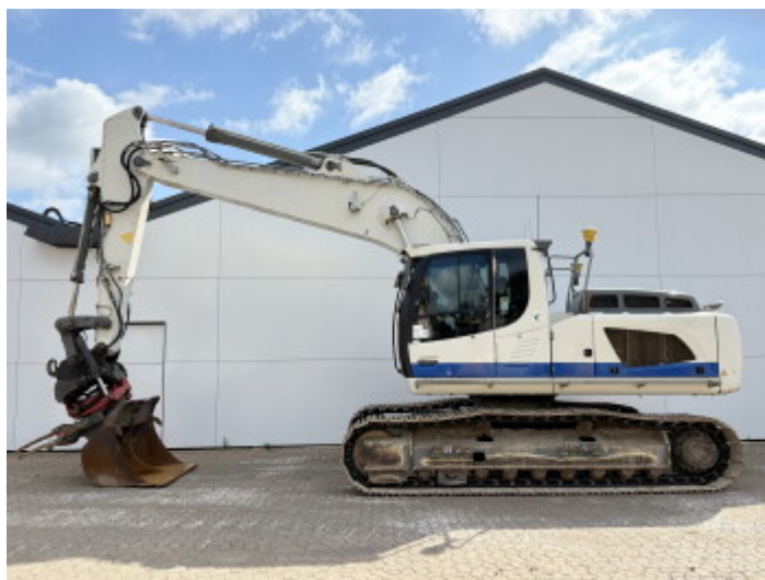
Plate % 60 Sprocket % 100 Chain % 100