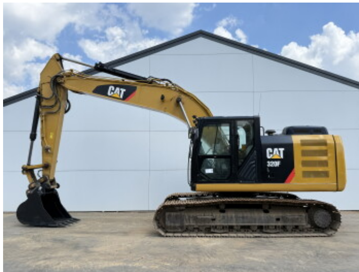
Plate % 90 Sprocket % 90 Chain % 90 Raupenbreite 80 cm