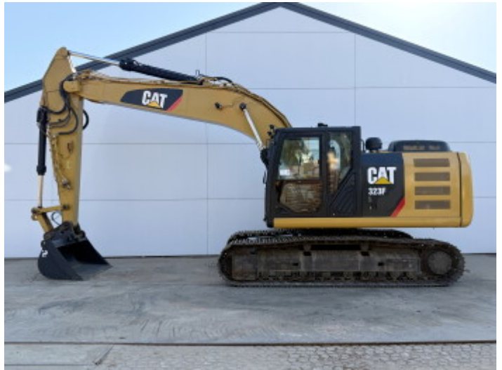
Plate % 60 Sprocket % 10 Chain % 10