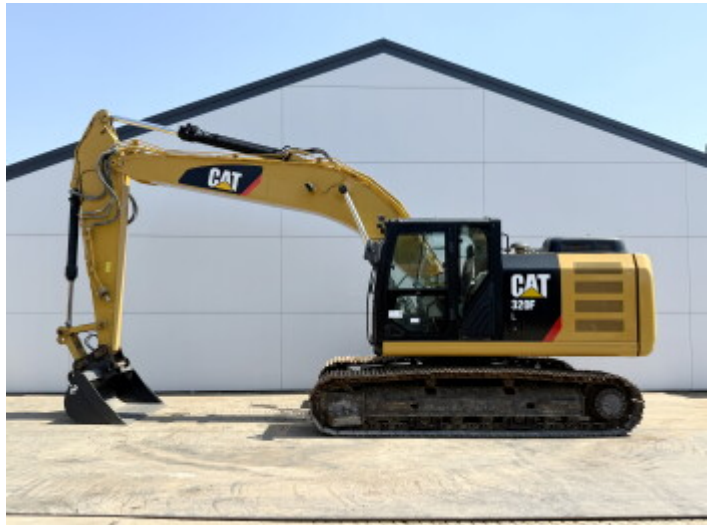
Plate % 60 Sprocket % 10 Chain % 10